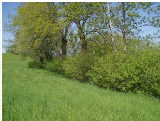
Repousses de noisetiers de 3 ans.