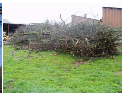
Mise en tas des branches avant broyage