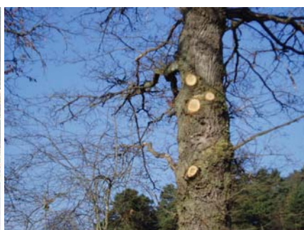
Emondage des arbres