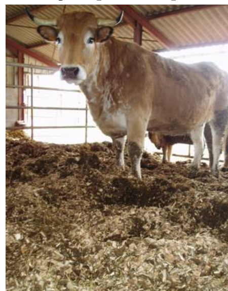
Vache sur litière composée de 50 % de copeaux issus de branchages des haies et de 50 % de paille.