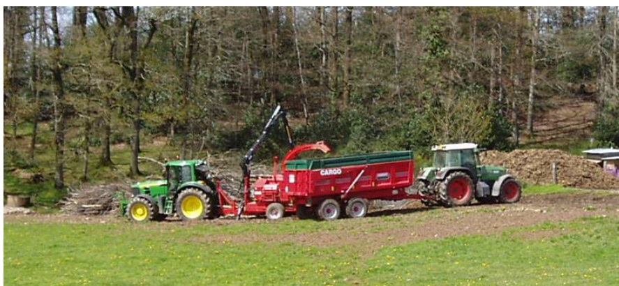
Chantier de bois déchiqueté en CUMA.

- les copeaux issus de petites branches produisent beaucoup d'écorces et de poussières, peu recommandées pour les chaudières à bois déchiqueté. Ils sont utilisés pour pailler le pied de plantations (se reprocher d'entreprises d'espaces verts), ou pour la litière des stabulations (remplacer 1/3 de paille par des copeaux).