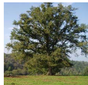
L'arbre du bocage : un tronc court et un gros volume de branches.

Aujourd'hui, la plupart des menus branchages ne sont pas valorisés, voire ils constituent une charge de travail car ils sont brûlés ou mis en tas. Le bois énergie est-il une solution pour valoriser ses branchages ?