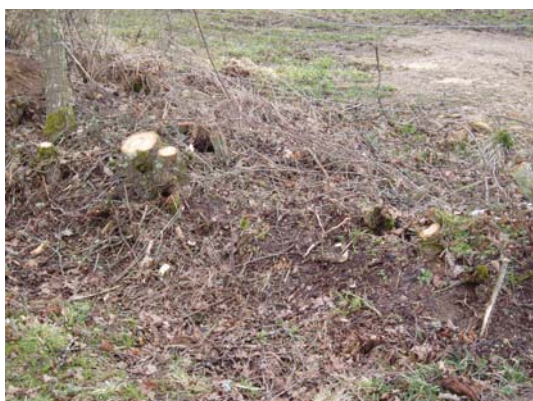
Coupe rase des arbustes année n

Une précaution toutefois : clôturer la haie pour éviter que les troupeaux n'abrutissent les repousses.