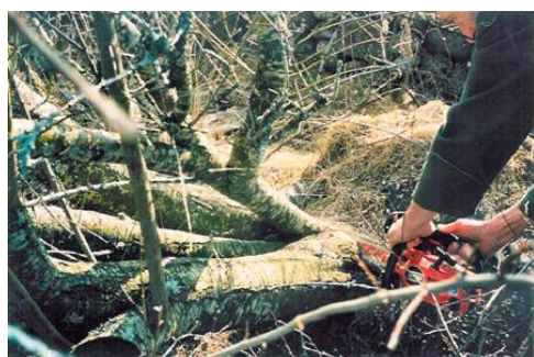
Recépage des arbustes à 10 cm de haut

Au bout de 15 ans, il faut alors récolter la haie au même titre qu'on récolte une culture , c'est-à-dire recéper les arbustes (les couper à 10 cm du sol) et émonder les branches latérales des arbres (les couper au ras du tronc) jusqu'à 4-5 m de hauteur.